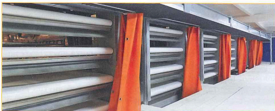
Фото 4. Транспортировочный лифт — автоматическая транспортировка птиц на погрузочную платформу

Транспортировочный лифт доставляет бройлеров до погрузочной платформы, которая устанавливается на уровне соответствующего яруса. В за-