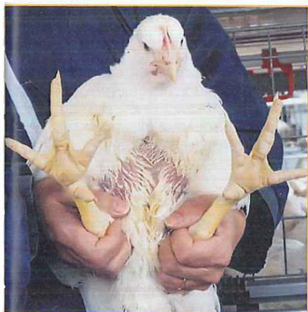
Фото 3. Упругая пластиковая сетка предотвращает образование мозолей на грудке, незначителен риск повреждения кожных покровов ступней

• упругая пластиковая сетка предотвращает образование мозолей на грудке, незначителен риск повреждения кожных покровов ступней (фото 3).