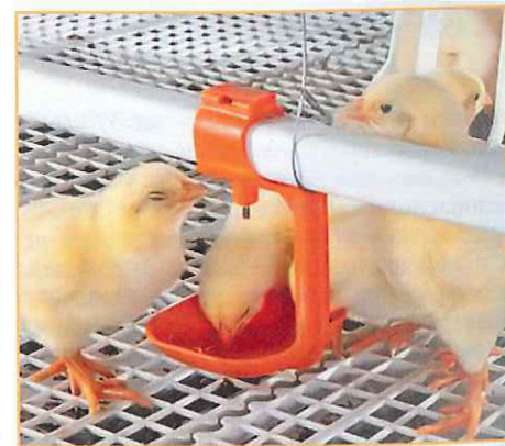
Фото 1 и 1а. Кормовые линии и линии поения оснащены центральным регулировочным механизмом, что позволяет оптимально регулировать их высоту согласно размеру птицы и с минимальными затратами труда