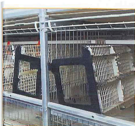
Фото 2. Откидной пол с пластмассовой решеткой гигиеничен и эластичен